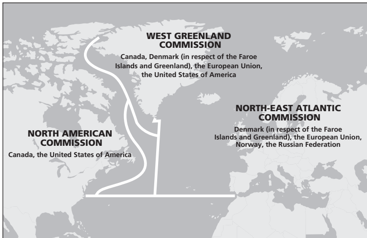
Map of the Convention area and Commissions of the North Atlantic Salmon Conservation Organization